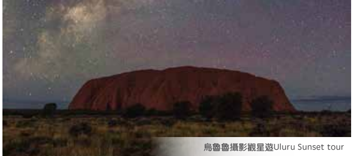
烏魯魯攝影觀星遊Uluru Sunset tour