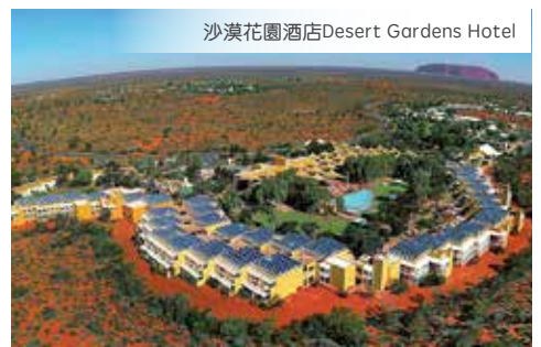
沙漠花園酒店Desert Gardens Hotel