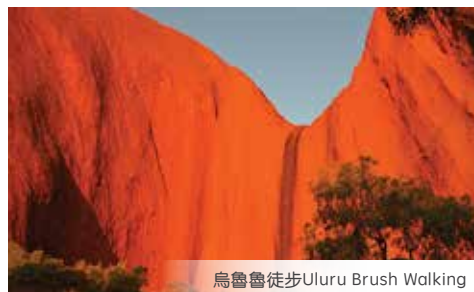
烏魯魯徒步Uluru Brush Walking

返回愛麗絲泉: 在Luritja Road和Lasseter Highway的交界處, 換乘英文旅遊巴士, 前往愛麗絲泉酒店後自由活動。RETURN ALICE SPRINGS: change coach at the Luritja Road & Lasseter Highway Corner > arrive hotel > at your own leisure