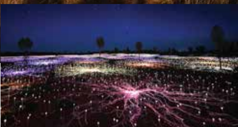
烏魯魯原野星光展Field of light Uluru