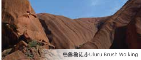
烏魯魯徒步Uluru Brush Walking