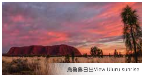
烏魯魯日出View Uluru sunrise