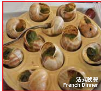
法式晚餐 French Dinner

Visa application materials can be requested by email, free of charge, when you book the tour with Nexus Holidays. A process fee of $180 is strictly applied, for any subsequent cancellations of the tour regardlessly.