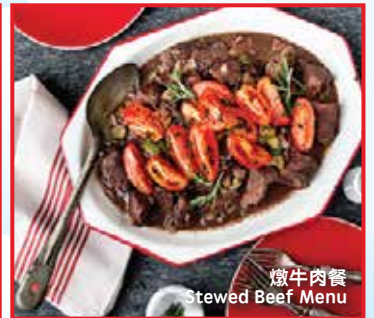
燉牛肉餐 Stewed Beef Menu