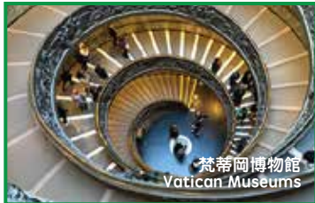
梵蒂岡博物館 Vatican Museums