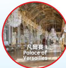
凡爾賽 Palace of Versailles