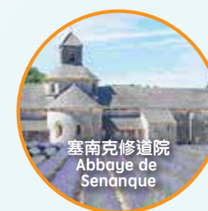
塞南克修道院 Abbaye de Senanque