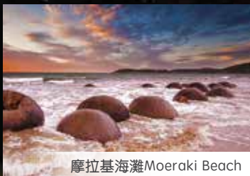
摩拉基海灘 Moeraki Beach