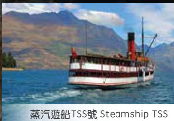
蒸汽遊船TSS號 Steamship TSS