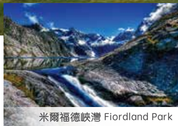
米爾福德峽灣 Fiordland Park

早餐後觀看●新西蘭田園農場表演Farm，有剪羊毛、牧羊犬趕羊、並有機會親手給羊寶寶餵奶。後前往具有濃郁地域特色的●毛利族文化村Te Puia，參觀毛利族的手工藝及歷史文物展示，觀賞頗為壯觀的地熱奇觀。中午享用美味午餐後，前往哈里王子和梅根鍾愛的●彩虹泉自然公園Rainbow Springs Nature Park，天然清澈的泉水養育著彩虹鱒魚，還有機會觀賞到新西蘭國寶Kiwi鳥和啄羊鸚鵡等諸多珍奇鳥類。隨後返回奧克蘭，晚餐後送回酒店休息。