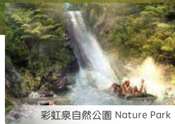
彩虹泉自然公園 Nature Park