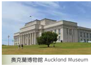
奧克蘭博物館 Auckland Museum