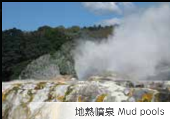
地熱噴泉 Mud pools