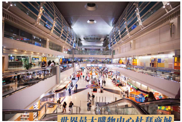
世界最大購物中心杜拜商城

沙迦市歷史博物館】，參觀完後前往文化廣場古蘭經雕塑、【火車頭傳統手工藝品市場】，星羅棋佈的阿拉伯小商店、貨品琳琅滿目，客人可以自由選購。午餐後返回酒店休息。午餐後前往世界第一高樓【哈利法塔】，它高達828米是香港IFC的兩倍，斥資30億美元造價。登上塔內第124層全球最高的觀景臺【At The Top】鳥瞰80公里全景，現代都市規劃佈局及奇異獨特摩天大樓，海天一色的美景盡收眼底。前往世界最大購物中心【杜拜商城】DUBAI MALL，擁有1200家世界名牌店，當然法國【老佛爺百貨Galeries Lafayette】也在其中，您可盡情享受這購物天堂的樂趣。外觀世界最大【室內人造瀑布】和【室內水族館】逾萬種海洋生物！最近角度欣賞世界最大的噴泉-【杜拜音樂噴泉】Dubai Fountain音樂噴泉每晚半小時一次，它成為杜拜乃至中東地區最絢麗的焦點，美妙絕倫、氣勢壯觀！晚上專車送往杜拜機場辦理登機飛往南非約翰內斯堡，您仍可在杜拜機場內【世界最大機場免稅店】Duty Free來彌補您意猶未盡的購物興致。